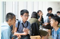
多様な価値観をもつ社会人、学生との交流・意見交換