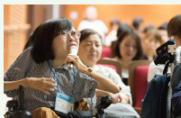
一般公開シンポジウムへの参加と情報発信