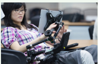
最先端のテクノロジー体験