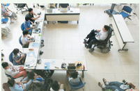
自立と自己決定、セルフアドボカシー、リーダーシップをテーマとしたセミナーやワークショップへの参加